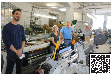
NOPE: Hanf besitzt natürliche viruzide, bakterizide und fungizide Eigenschaften. In einem Kooperationsprojekt soll nachgewiesen werden, dass Hanf auch in gewebter oder gestrickter Form diese Eigenschaften behält.