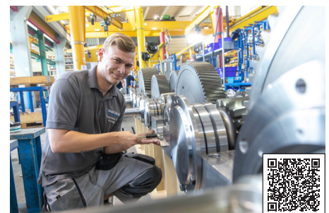
Digitaler Zwilling: Im Projekt geht es um die Entwicklung Digitaler Zwillinge, die zur Prozess- und Anlagensimulation, zur Anlagenmodellierung und für Datenmodell genutzt werden können.